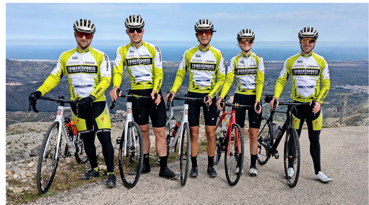
Erfolgreich: Das Rennteam Tower Sports-VC Eschenbach kann sich mit nationaler und internationaler Konkurrenz messen.