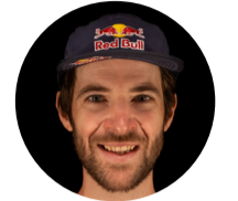
Lars Forster, Rieden Weltcupsieger Mountainbike