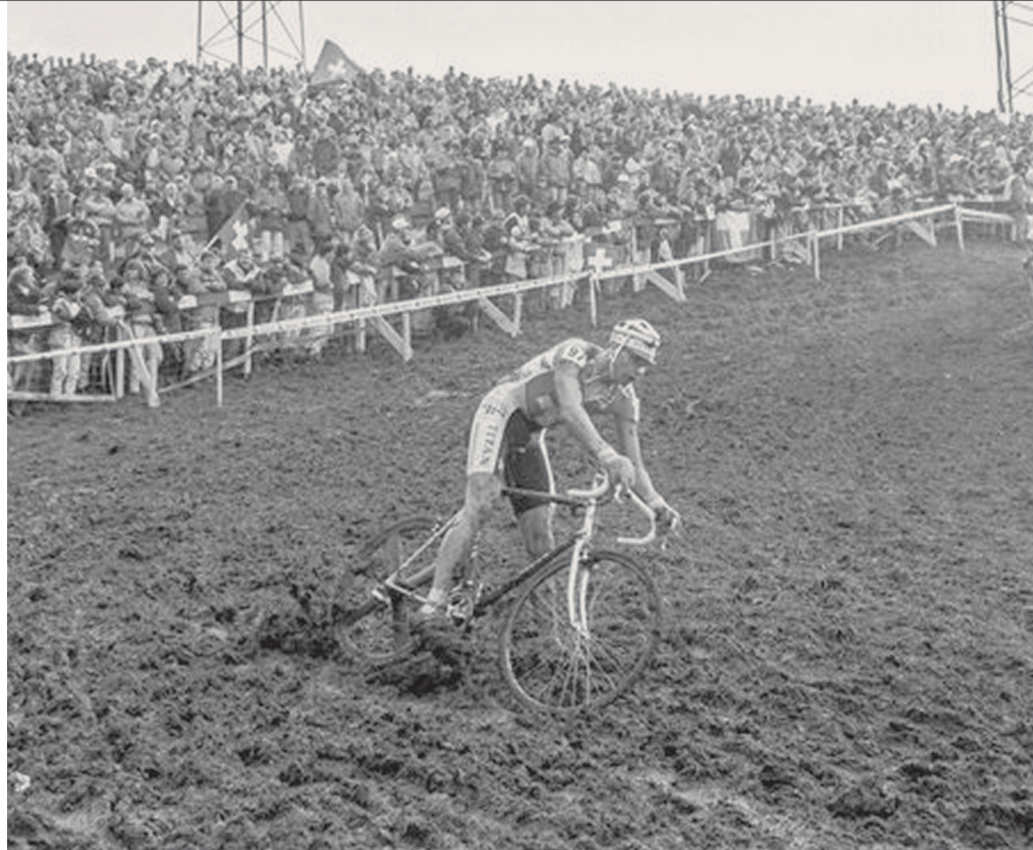
1995: Vor Tausenden von Fans findet in Eschenbach die Radquer-Weltmeisterschaft statt. Es ist eines der grossen Highlights in der Geschichte des Veloclubs Eschenbach.