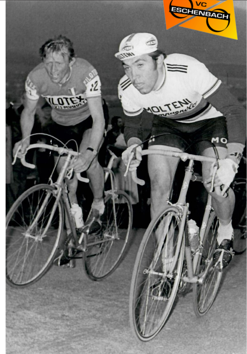
1974: «Kannibale» und Radlegende Eddy Merckx (rechts, auf dem Bild mit Sepp Fuchs) gewinnt die Tour-de-Suisse-Etappe nach Atzmännig.