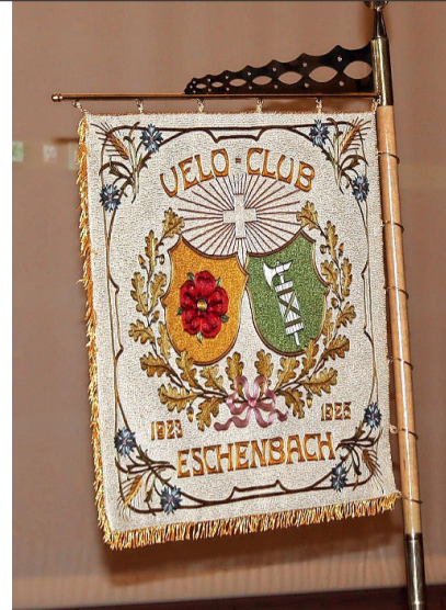
1925 eingeweiht: Die VCE-Fahne.